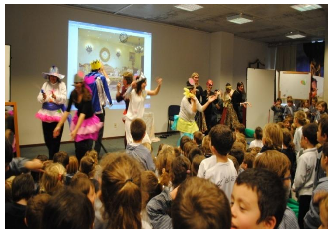
Una escena de teatro en Stella Maris con motivo de la celebración del Día del Niño.

Los más pequeñitos gozaron de La Cenicienta; la puesta en escena fue preparada por sus propios docentes. Entre fantasía y realidad, quedaron sorprendidos de descubrir que eran sus maestros, catequistas, y psicólogo quienes representaban a los personajes. ¡Fue una tarde de alegría y regocijo!