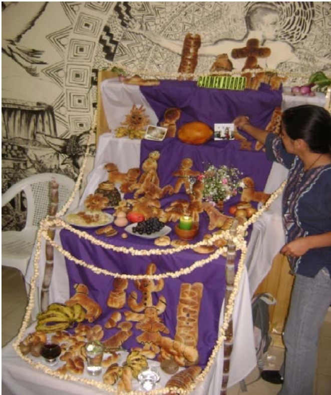
La mesa de panes y frutas ofrecida por una comunidad de Hermanas en Cochabamba.