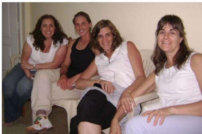
Cuatro de las profesoras del Colegio Stella Maris que hicieron una misión social en Bolivia.

Los uruguayos trabajaron en un hogar de niñas, en nuestra oficina con los niños trabajadores y con niños en un barrio popular del sur de la ciudad. Era un grupo muy entusiasta, muy alegre quienes nos contagiaron a nosotros. Abajo, hay una foto de algunas de ellas.