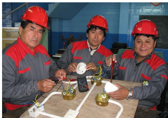
Tres ex pescadores que estudian Instalaciones Electro-técnicas (Electricidad) en el Centro Técnico Mundo Mejor se muestran contentos al armar su módulo.