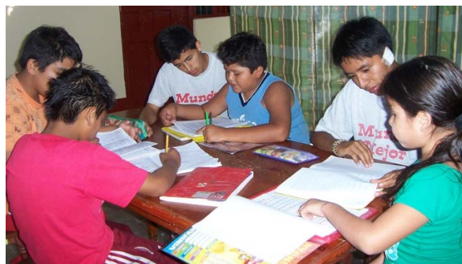
Dos alumnos del colegio atienden a los niños en refuerzo escolar, parte de la Pastoral Externa de alumnos de Quinto de Secundaria.

El Hno. Vicente Peragine este año sigue enseñando inglés en la universidad San Pedro que quiere decir que está full chamba: en el colegio por la mañana y en la universidad por las noches. Sigue reuniéndose con los Asociados de ER, compartiendo la oración, vivencias y un pequeño lonche con ellos en la casa.