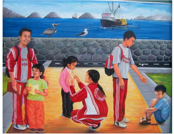
Una escena de alumnos de Mundo Mejor atendiendo a los niños pobres en Pastoral Externa frente a la bahía de Chimbote.

“Dos puertos en mares lejanos se dan la mano...” Chimboté-- Waterford