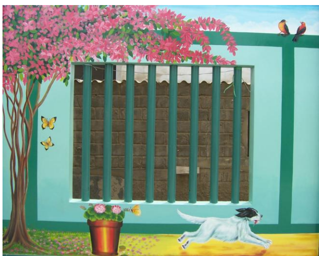
Esta ventana se comunica con nuestra vecina, la parroquia san Martín.