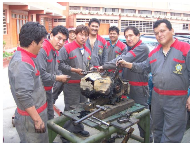
Un grupo de estudiantes de Mecánica Automotriz desarman un motor como parte de sus prácticas.

La campaña entre exalumnos del colegio para conseguir computadoras para el CETPRO ha comenzado a rendir frutos: la Promoción 1974 ha ofrecido donar un equipo y eso ha hecho sonreír al Hno. Ricardo Glatz. El sábado, 13 nov., comenzó el último campeonato interno de fútbol; este módulo participan ocho equipos.