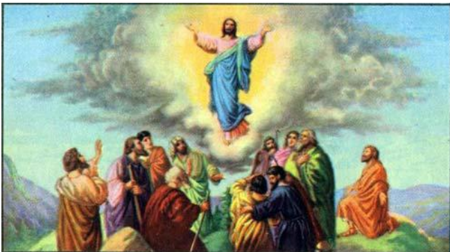
La Ascensión de Cristo – 16 de mayo.