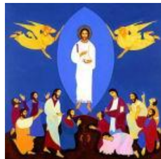
Pentecostés – 23 de mayo

El viernes, 7 de mayo, se realizó el tradicional torneo de fútbol Edmundo Rice en el que