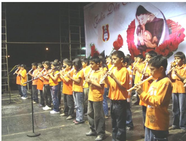
Alumnos de 1º Naranja tocan para sus mamás.

Cuando el otoño está muy avanzado y las noches algo frías, todavía en Chimbote tenemos días muy soleados. Realmente es uno de los mejores climas de la Región, aunque lamentablemente la contaminación urbana y fabril a veces empaña el cielo azul de la bahía. Nuestra comunidad sigue la rutina del colegio secundario y del Centro Técnico.