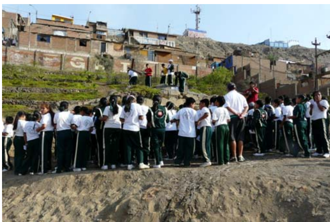
El vía crucis organizado por el Grupo ADER (Amigos de Edmundo Rice) con alumnos de la secundaria.