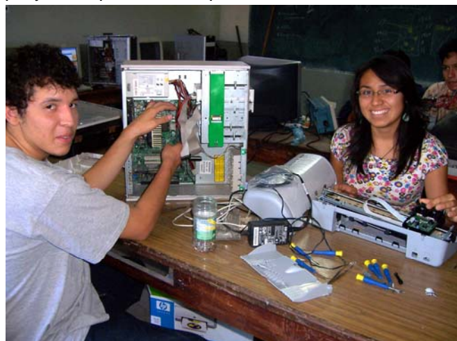
La campaña para tener mujeres en el CETPRO comienza a rendir frutos en Electrónica.

Estamos participando en un proyecto de Caritas que nos proveerá de equipos de tecnología moderna para las especialidades de Mecánica Automotriz (kits de conversión a gas vehicular y motores a gasolina) y Construcciones Metálicas (corte por plasma). Asimismo, los profesores recibirán una capacitación intensiva en el uso de estos equipos y habrá fondos para implementar proyectos productivos para nuestros estudiantes.