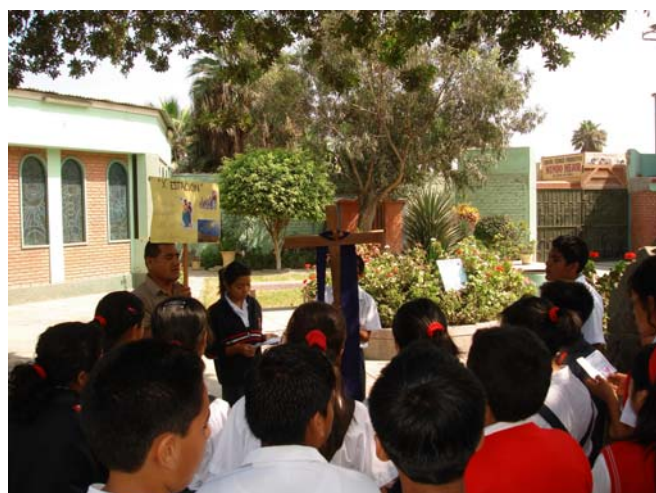
El vía crucis en el jardín frente a la capilla.